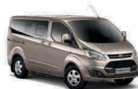
Gris Techno Color metalizado plus*