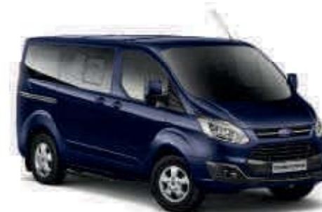
Azul Báltico Color sólido