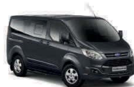
Magnetic Color metalizado*