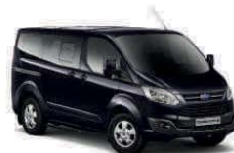
Shadow Black Color metalizado*