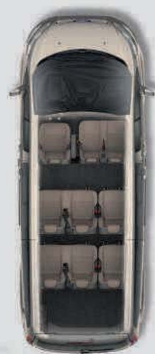
Tourneo Custom L2.