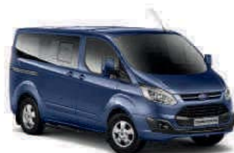
Azul Stratosphere Color metalizado plus*