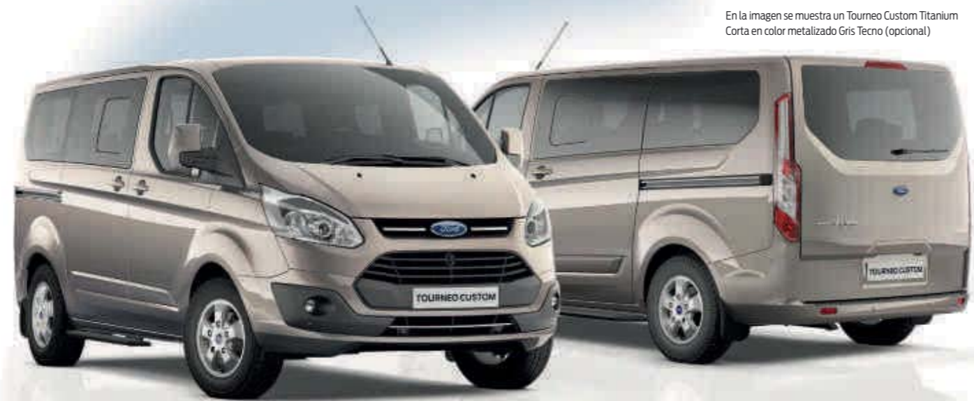
En la imagen se muestra un Tourneo Custom Titanium Corta en color metalizado Gris Tecnó (opcional)