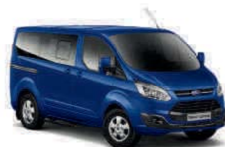
Azul Impact Color metalizado*