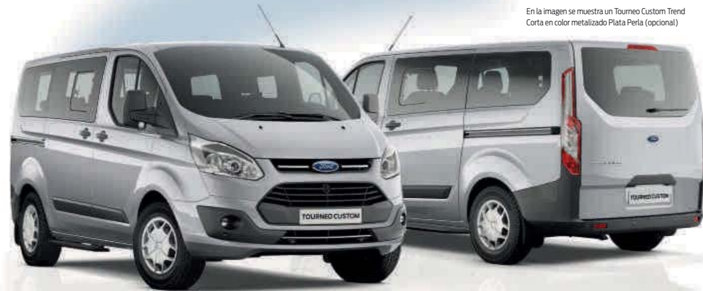
En la imagen se muestra un Tourneo Custom Trend Corta en color metalizado Plata Perla (opcional)