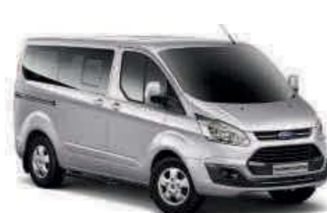
Plata Perla Color metalizado*