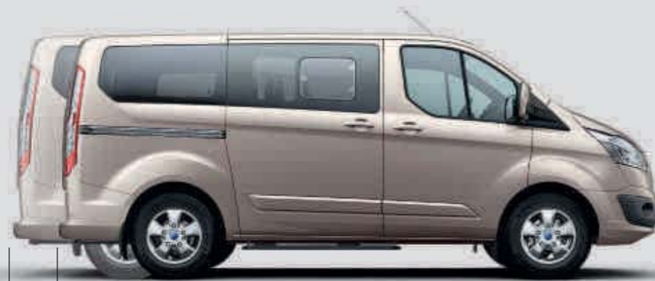
Tourneo Custom L1 con 8-9 asientos Tourneo Custom L2 con 8-9 asientos