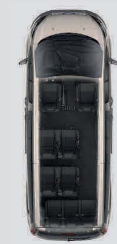
Opción Asientos de Lanzadera

Centrada en la comodidad del pasajero, la nueva Opción de Asientos Servicios de Lanzadera ofrece un espacio generoso en cualquiera de sus cuatro filas de fácil acceso gracias a los escalones de la puerta. Disponible en ambas versiones, es la manera ideal de maximizar la comodidad del pasajero y la movilidad en el espacio del equipaje.