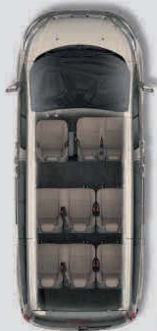
Tourneo Custom L1.

Cuando se trata de confort y bienestar, el Ford Tourneo Custom excede todas las expectativas. Ofrece el diseño, estilo y calidad de una berlina de lujo junto con la versatilidad, flexibilidad y espacio interior de un vehículo de transporte de pasajeros. El alto nivel de equipamiento, amplio y cuidado, proporciona aún mayores índices de refinamiento. El asiento del conductor y la columna de dirección son totalmente ajustables, permitiéndote encontrar la posición de conducción ideal. Además, tus pasajeros pueden relajarse gracias al aire acondicionado en la parte trasera del habitáculo, respaldos reclinables y la envolvente tapicería de cuero.