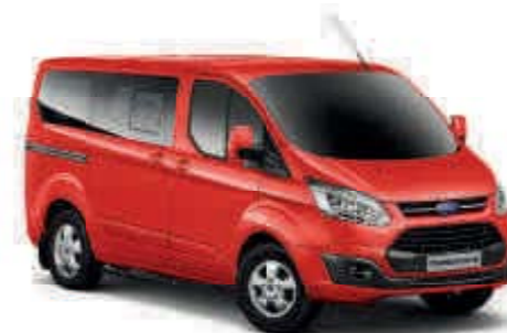
Rojo Race Color sólido