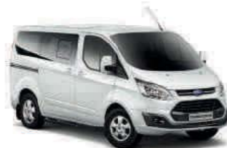
Blanco Color sólido