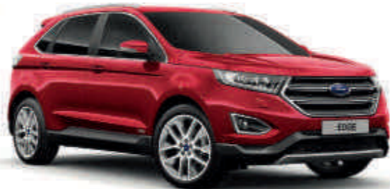
Rojo Rubí Metalizado tricapa* Td T S