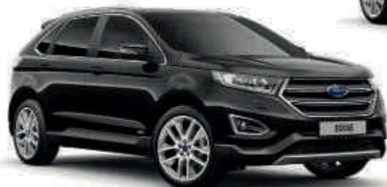
Negro Shadow Mica* Td T S V