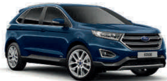
Blue Jeans Metalizado* Td T S

Hemos elegido Canyon Ridge. ¿Con cuál te quedarías tú?