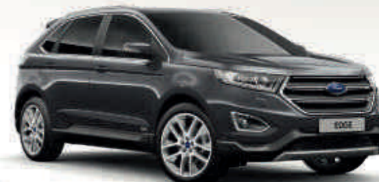
Gris Magnetic Metalizado* Td T V

El Ford Edge debe su atractivo y durabilidad exterior al proceso de acabado multifase especial. Desde las secciones de carrocería de acero con cera inyectada hasta el último revestimiento de protección, los nuevos materiales y procesos de aplicación garantizan que tu Ford Edge permanecerá en buen estado durante muchos años.