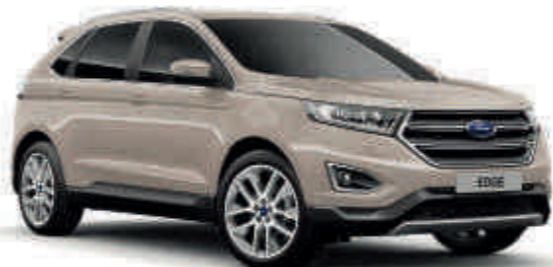
Blanco Gold Metalizado* Td T