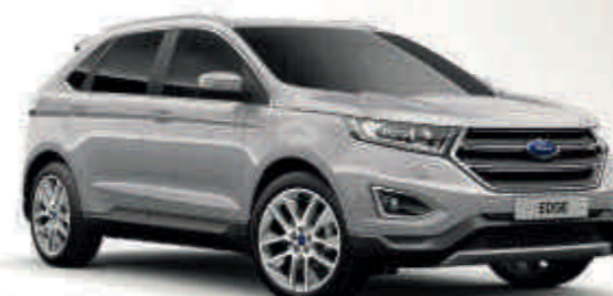
Plata Ingot Metalizado* Td T S