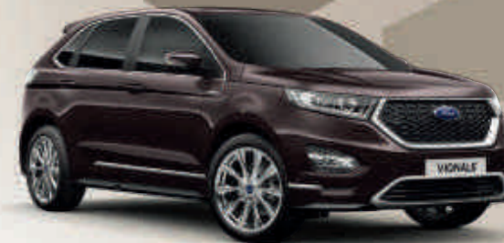
Ametista Scura † Metallic body colour V