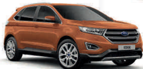
Canyon Ridge Metalizado* Td T S