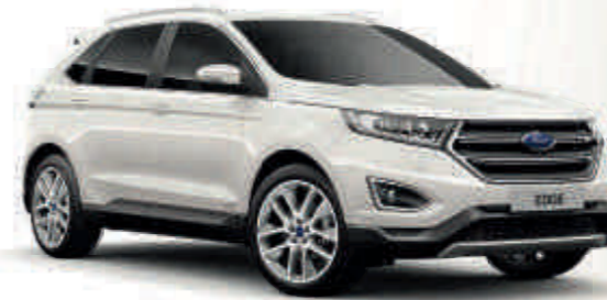
Blanco Platinum Metalizado tricapa* Td T S V