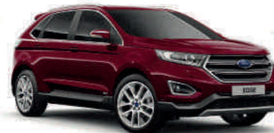
Burdeos Velvet Tri-Coat Metallic* Td T S

¿Quieres probar diferentes configuraciones del Ford Edge?