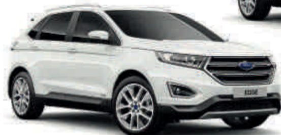
Blanco Oxford Sólido Td T S