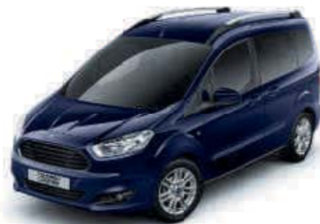
Azul Báltico Color sólido

La nueva Tourneo Courier debe su durabilidad exterior al completo proceso de acabado multifase. Desde las secciones de carrocería de acero con cera inyectada hasta el resistente último revestimiento, los nuevos materiales y procesos de aplicación garantizan una carrocería que permanecerá en buen estado durante muchos años.