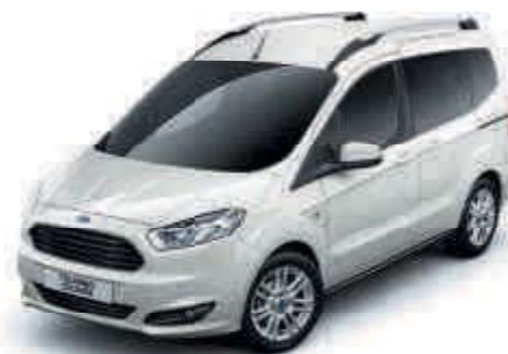
Blanco Color sólido