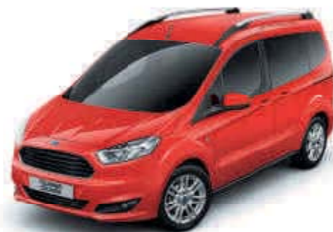
Rojo Race Color sólido