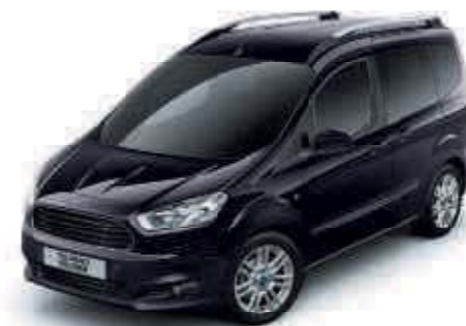
Negro Shadow Color metalizado*