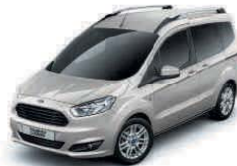
Plata Perla Color metalizado*