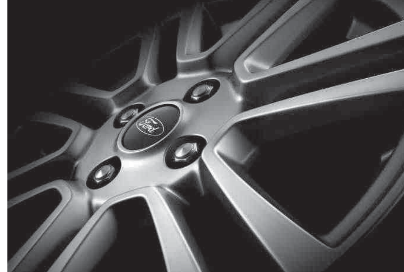
Llanta de aleación de 16" y 7 radios (de serie en Titanium)

Llanta de aleación de 16" y 7 radios (de serie en Titanium, opción en Trend)