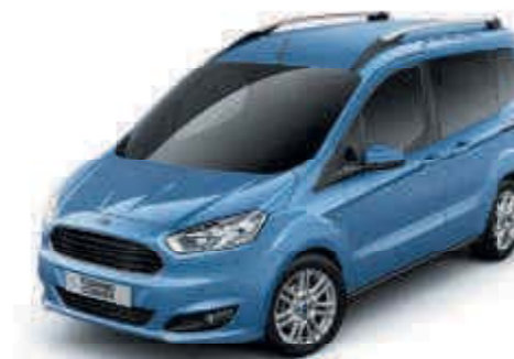
Azul Iceberg Metalizado especial*†