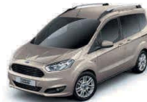
Gris Techno Color metalizado*