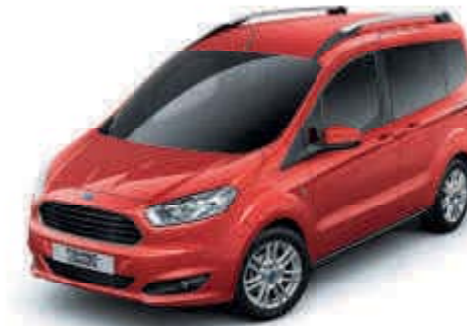
Rojo Venice Metalizado especial*†