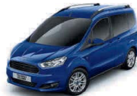
Azul Impact Color metalizado*