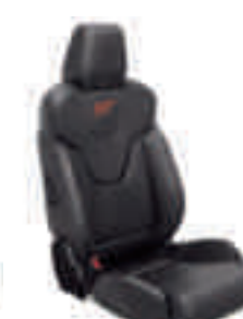
ST3 Frente de asiento y apoyo lateral en cuero Windsor Negro Charcoal

*El color blanco y los colores especiales y metalizados son opciones con coste adicional.