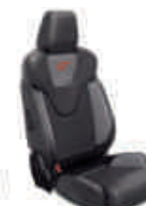
ST2 Frente de asiento en cuero parcial Negro Charcoal con apoyo lateral en Gris Storm