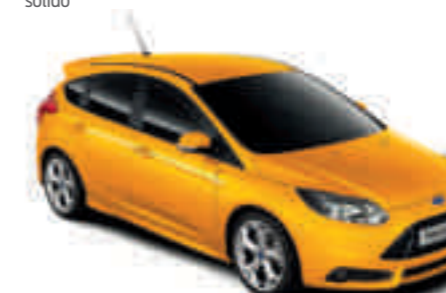
Amarillo Scream metalizado especial*