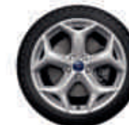
Llantas de aleación 18" (De serie)