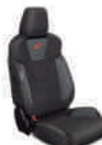
ST1 (no disponible) Frente de asiento en tela Lux Negro Charcoal con apoyo lateral en Gris Antracita