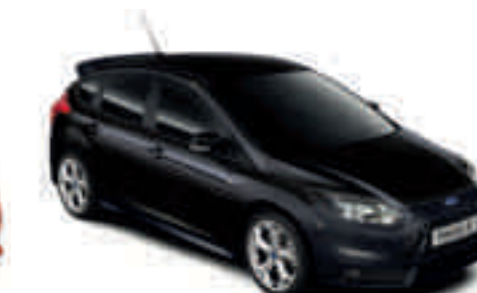
Negro Grafito metalizado*