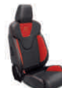
ST2 Frente de asiento en cuero parcial Negro Charcoal con apoyo lateral en Rojo Race