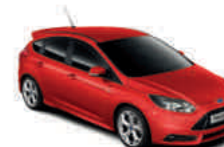
Rojo Vulcano sólido