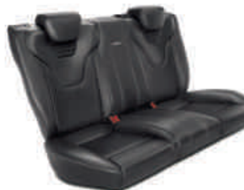
Asientos traseros Recaro con 3 plazas individuales con tapicería en cuero Windsor Negro Charcoal (De serie en ST3)