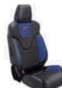
ST2 Frente de asiento en cuero parcial Negro Charcoal con apoyo lateral en Azul Racing