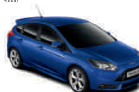
Azul Racing metalizado*