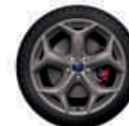
Llantas de aleación 18" en acabado Gris magnético con pinza de freno en color rojo (Opción)