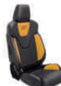
ST2 Frente de asiento en cuero parcial Negro Charcoal con apoyo lateral en Amarillo Scream