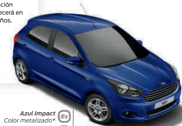
Azul Impact Color metalizado* Es UL

El Ford KA+ debe su belleza y durabilidad exterior al proceso de acabado multifase especial. Desde las secciones de carrocería de acero con cera inyectada hasta el último revestimiento de protección, los nuevos materiales y procesos de aplicación garantizan que tu KA+ permanecerá en buen estado durante muchos años.