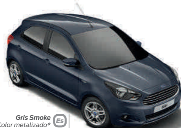
Gris Smoke Color metalizado* Es UL