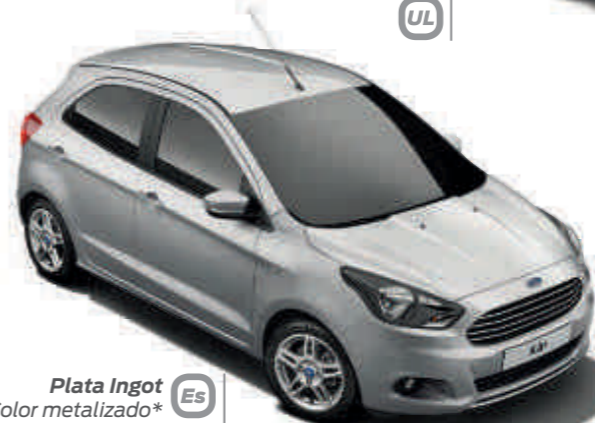
Plata Ingot Color metalizado* Es UL