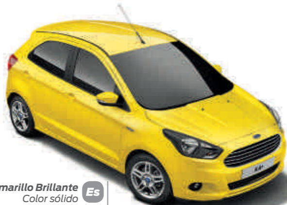
Amarillo Brillante Color sólido Es UL

Es Es Essential UL UL Ultimate De serie Opción