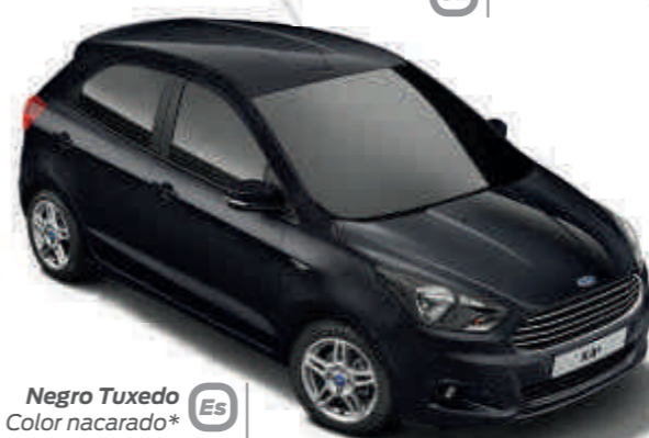
Negro Tuxedo Color nacarado* Es UL