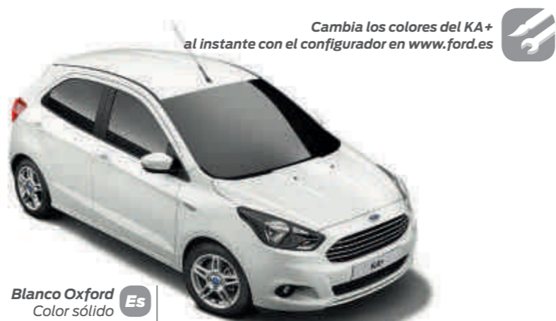
Blanco Oxford Color sólido Es UL