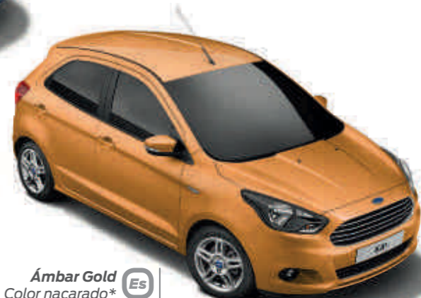
Ámbar Gold Color nacarado* Es UL