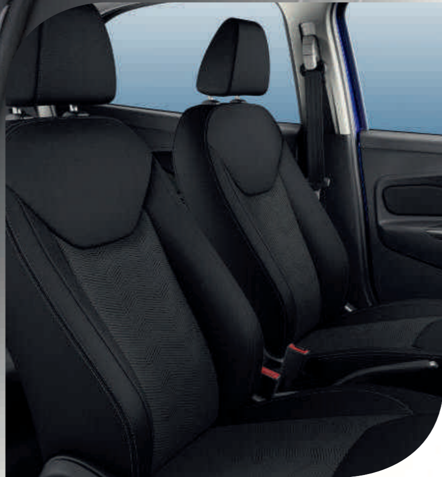
Frente de asiento: Lodha en Dark Shadow Lateral de asiento: Vigo en Negro Charcoal Costuras: Fog Grey