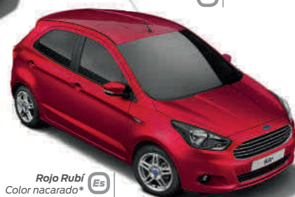
Rojo Rubí Color nacarado* Es UL